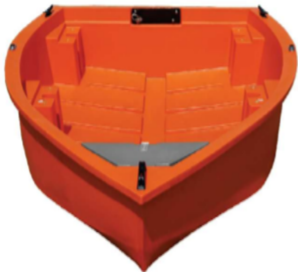
Trup s pramčanim ormarićem