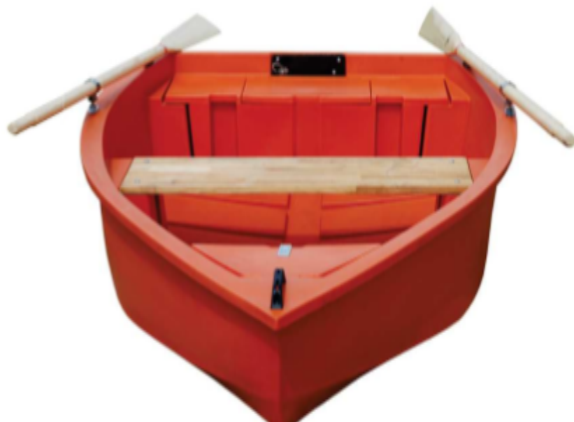
Trup s pramčanim i krmenim ormarićem i drvenom klupom

Media Boss j.d.o.o Kardinala Alojzija Stepinca 88 21220 Trogir, Croatia +385 21 494 092 +385 98 942 1610