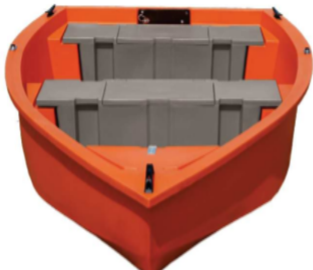
Trup s pramčanim, krmenim i središnjim ormarićem