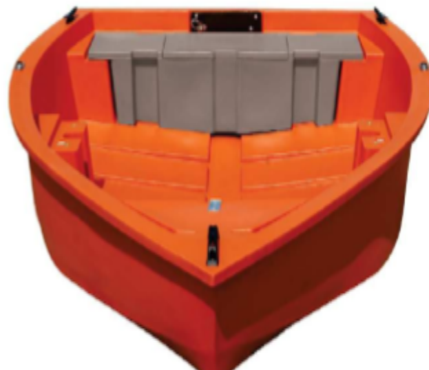
Trup s pramčanim i krmenim ormarićem